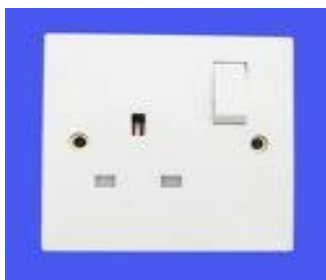
3 pin socket with Box and switch