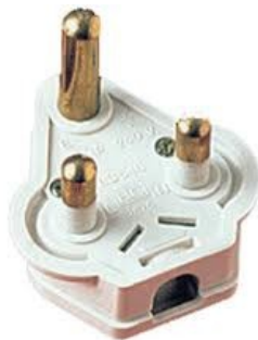
3 Pin Plug 15 A

UPS വിതരണം ചെയ്യേണ്ട സ്കൂളുകളിലെ SITC മാരെ വിളിച്ച് പ്രവർത്തനം വിശദീകരിക്കാവുന്നതാണ് അങ്ങനെയെങ്കിൽ വയറിംഗ് ലേഔട്ട് അയച്ചുതരാം. ഉപകരണങ്ങൾ Brand കർശനമല്ല .