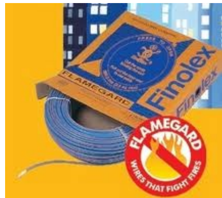
2.5 mm Wire